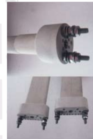
Resistencias cerámicas. Ceramic heating elements. Resistances Ceramiques.